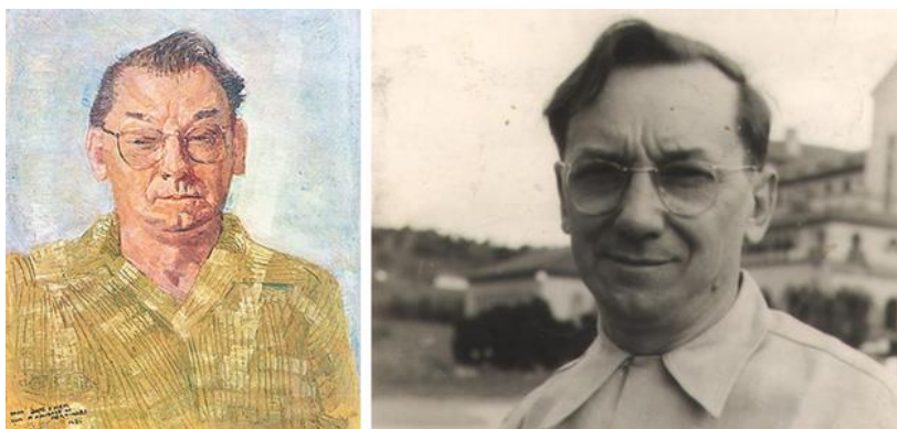
À esquerda, autorretrato de Portinari. À direita, retrato fotográfico do pintor.

Além da pintura, Portinari também se dedicou à ilustração, gravura e à docência, sendo professor de artes plásticas.