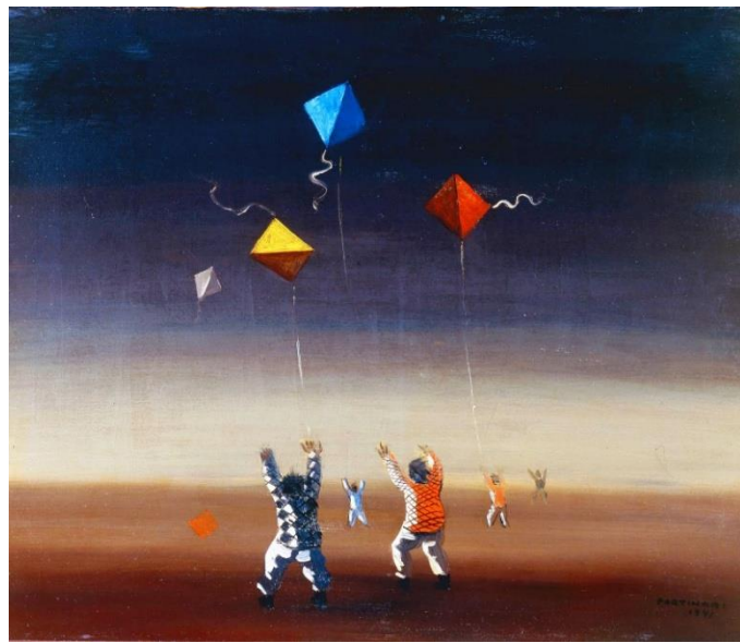
Meninos soltando pipa (1941), Portinari.

Faça uma pesquisa sobre outras obras de Candido Portinari relacionada a brincadeiras de criança.