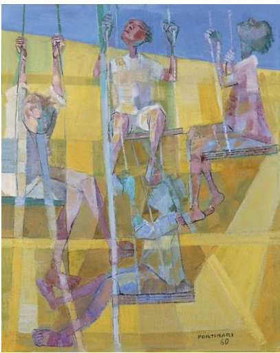
Meninos no balanço (1960), Portinari.