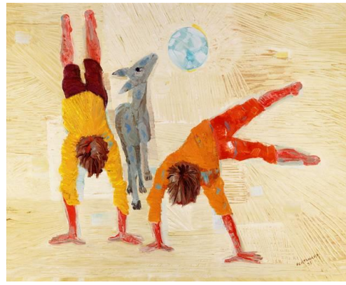
Meninos Brincando (1955), Portinari.